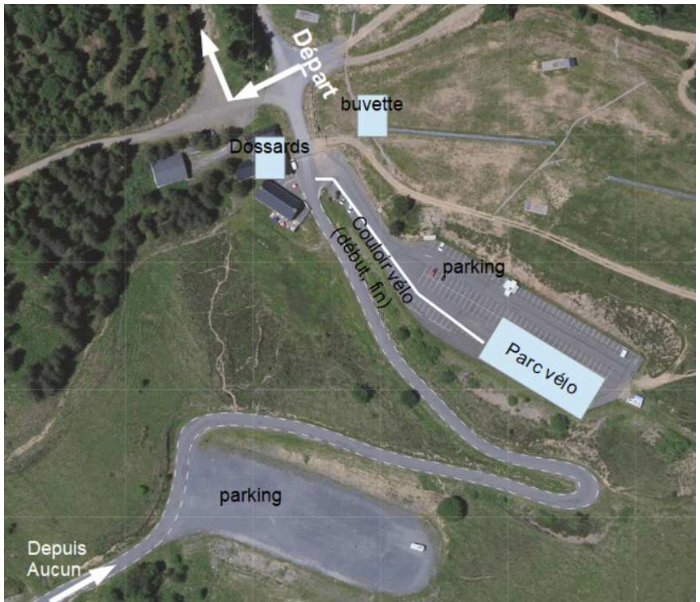
Vue du site de Couraduque

Il n'y aura pas de vestiaires ni de douches. Les WC de la station seront ouverts.