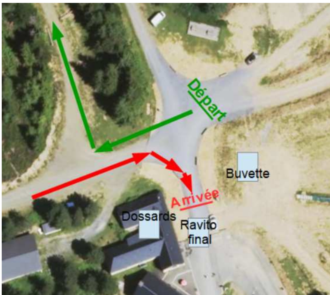
Zoom sur la zone de course au col de Couraduque

Pour rappel, le duathlon L a été annulé par manque de participants.